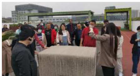
参观宝山智慧湾科创园