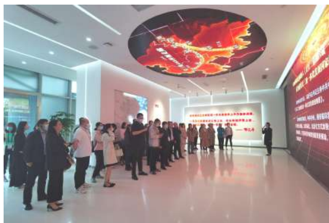
参观松江G60科创走廊