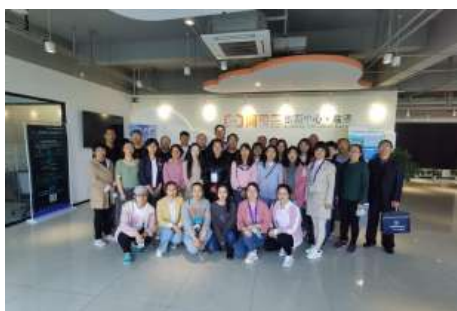
参观临港新片区、海洋高新区科创园区