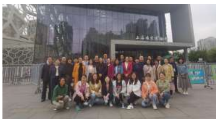
参观上海自然博物馆