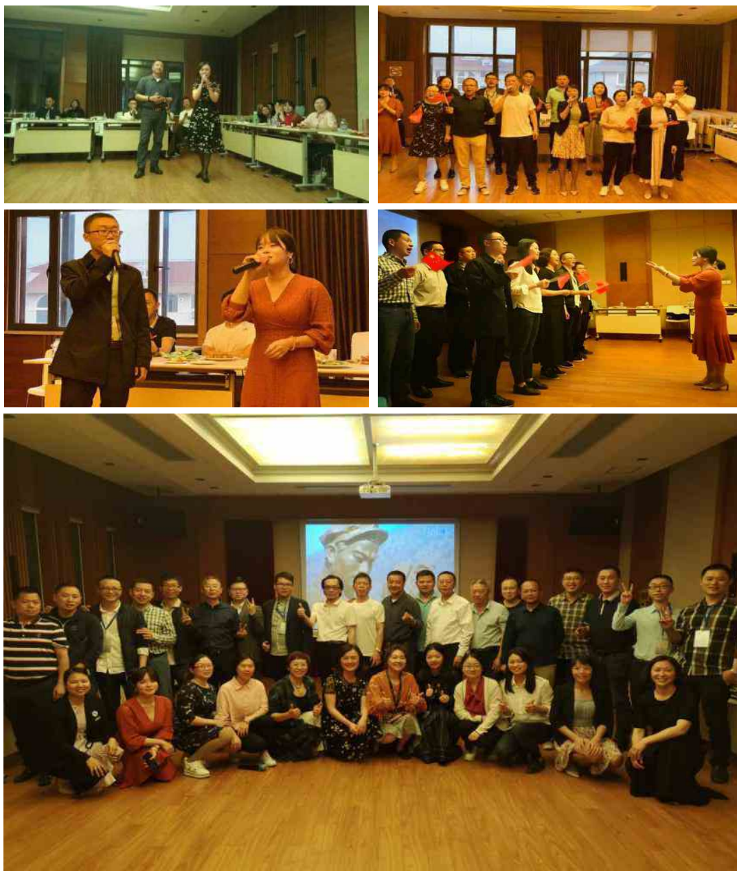
学员与老师共同联欢